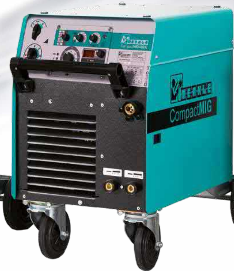
CompactMIG 400 K