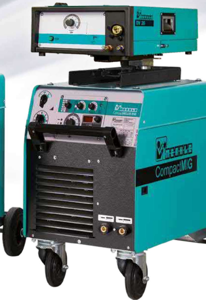
CompactMIG 400 DW