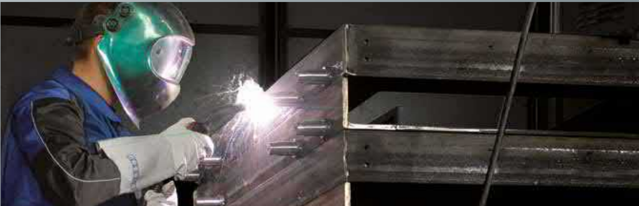
RedMIG 3000 D