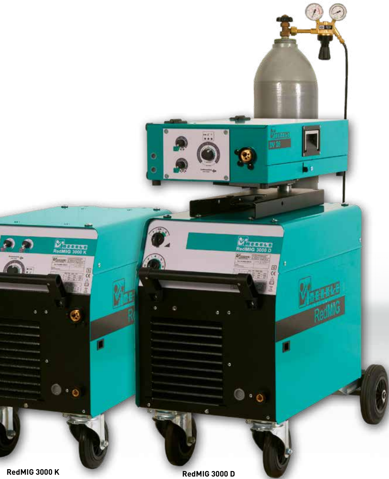
RedMIG 3000 K