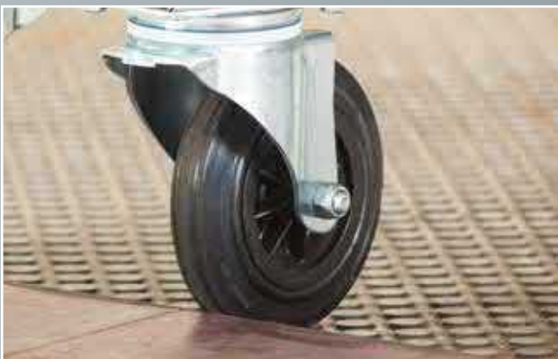
Extragroße Lenkrollen (160 mm) und komfortable Bockrollen (200 mm)