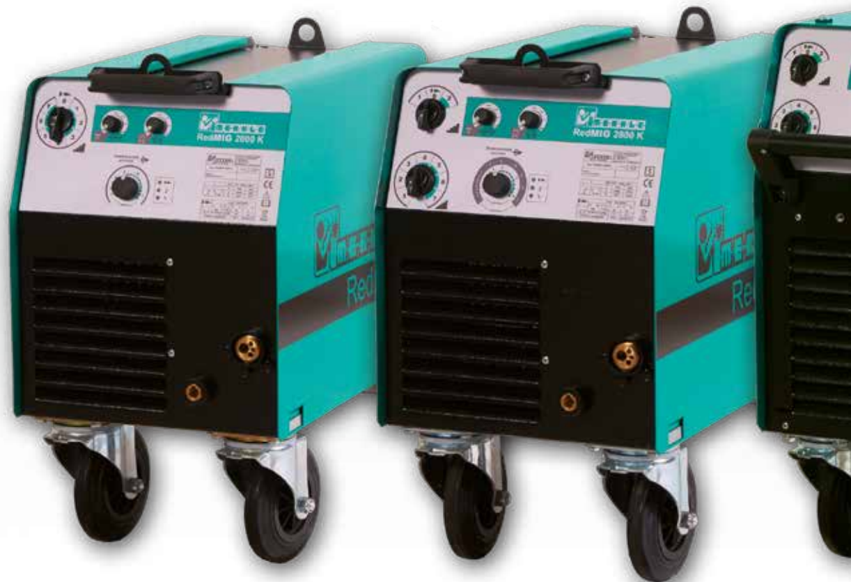
RedMIG 1600 K /2000 K