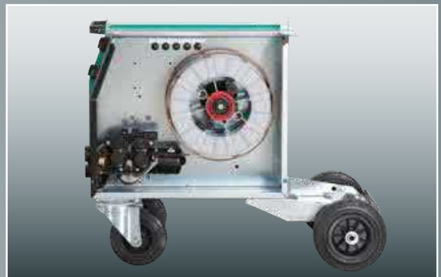
Drahtvorschubsystem und Drahtspule sind übersichtlich und leicht zugänglich angeordnet.