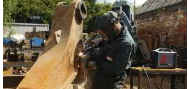
Wartung und Reparatur