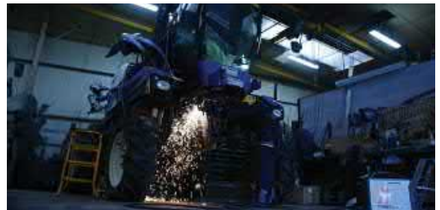
Wartung von landwirtschaftlichen Geräten